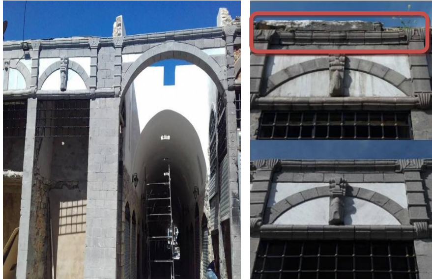
الشكل (21) يوضح المحافظة على شكل الواجهات كما كانت في السابق