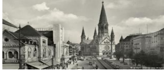
الشكل (10): كنيسة الذكريات في