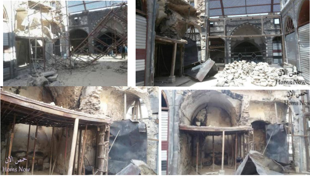
الشكل (19) الانهيار الحاصل في بعض أجزاء السوق بعد الترميم