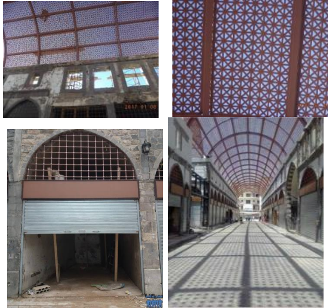
الشكل (20) الشكل النهائي للسوق المسقوف بعد إعادة بناء السقف المعدني وشكل سحاب المحلات التجارية