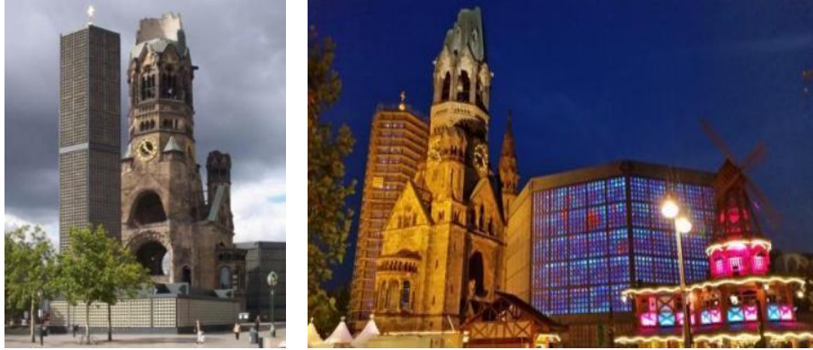
الشكل (11) كنيسة الذكريات في مدينة برلين -ألمانيا بعد الحفاظ عليها كمعلم أثري