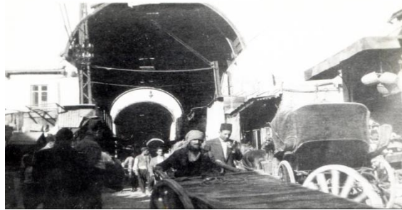
الشكل (14) يوضح البدايات التي كان عليها السوق المسقوف في حمص (ظهر السلحفاة)