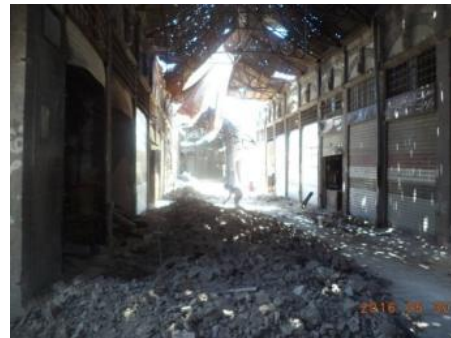
الشكل (16) آثار الدمار والحرق في الأسقف والأرصيات والمحلات التجارية