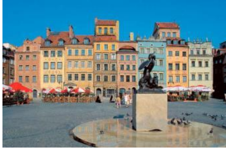
الشكل (3): الساحة الرئيسية في البلدة القديمة في مدينة وارسو- بولندا بعد إعادة الإعمار

مثال 1: مدينة وارسو - بولندا الساحة الرئيسية