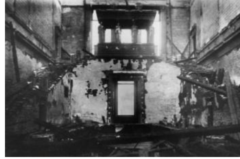
الشكل (4): المتحف الحديث ألمانيا قبل غارات 1943 م