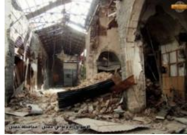
الشكل (15) صور الخراب والدمار في السوق المسقوف