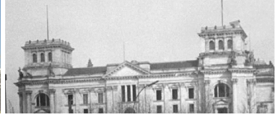
الشكل رقم (8) البرلمان الألماني بعد إعادة البناء