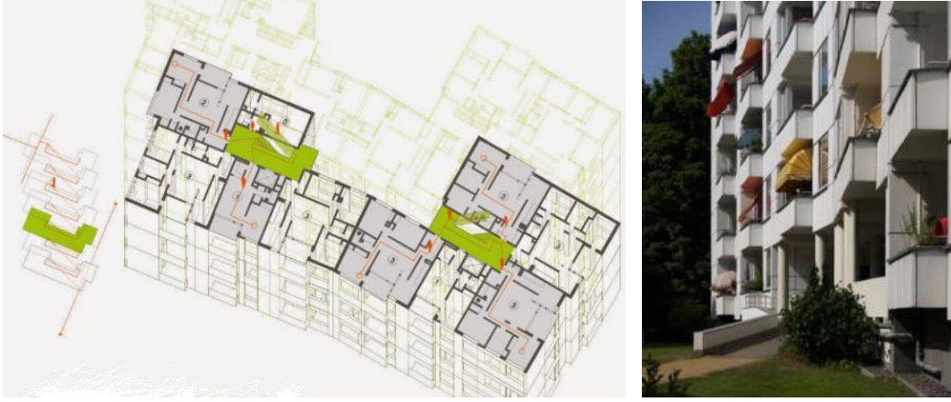
الشكل (1): نموذج للإسكانات المستحدثة في برلين بعد الحرب العالمية (alvar alto) مسقط أفقي.