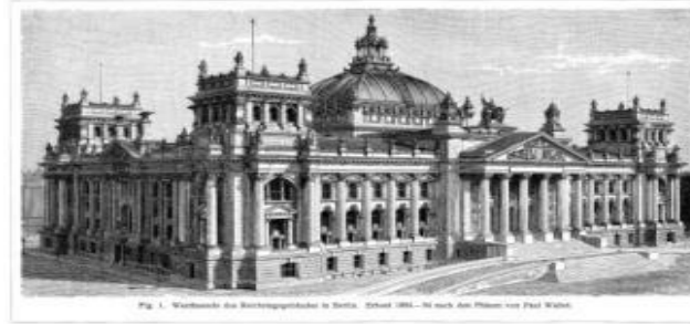
الشكل رقم (6) مبنى البرلمان الألماني عام 1894م.

يعود تاريخ المبنى إلى عام 1884م، حين بدأ المعماري الألماني باول فالوت بالإشراف على تشييده وانتهى العمل عام 1894م وبعد عشر سنوات من البناء، تم استكمال البرلمان وعلت قبته قلعة المدينة بعد ذلك. وقد تم تشييده على طراز البناء المعروف بعصر النهضة الجديد حيث تتداخل فيه العناصر الفنية لعصري النهضة والباروك.