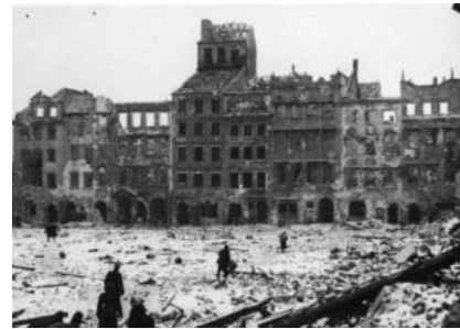
الشكل (2): الساحة الرئيسية في البلدة القديمة في مدينة وارسو- بولندا بعد الحرب