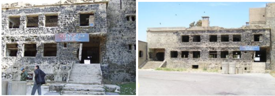
الشكل (12) مشفى القنيطرة شاهد على الدمار

مثال 2: مشفى القنيطرة (مشفى الجولان)- هضبة الجولان- سورية