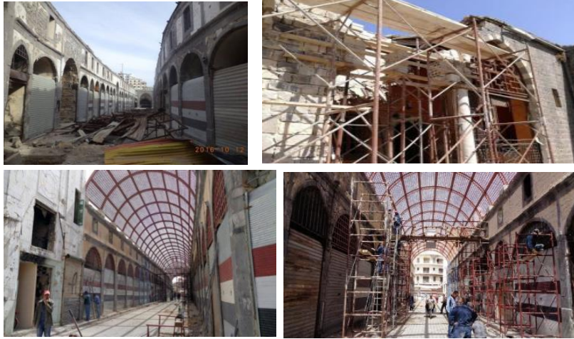
الشكل (18) أعمال الترميم في السوق النوري - المسقوف