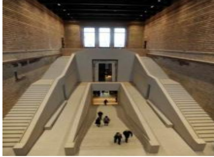
الشكل (5): المتحف الحديث برلين ألمانيا 2009م.

المثال 1: المتحف الحديث في برلين- ألمانيا