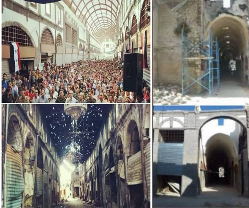
الشكل (22) يوضح الفرق بين السوق بعد الحرب وبعد الترميم

ويتوافق مع البند الثاني من نفس الميثاق والذي ينص على "الحفاظ على المباني الأثرية والاهتمام بها بشكل يؤدي إلى استمرارية حياتها أو إعادة استخدامها بوظائف تحترم طابعها التاريخي والفني وهنا تعتبر تجربة إعادة تأهيل السوق هي التجربة الأولى في سورية حالياً بعد الحرب وذلك لأهمية السوق وموقعه كان لابد من إعادة تأهيله وإعادة توظيفه بوظائفه السابقة نفسها تجاري سكني.